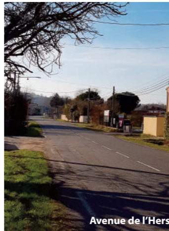
Avenue de l'Hers

Les services de la mairie réaliseront l'aménagement du cheminement piétonnier allant du pont de l'Hers vers Ayguesvives dès le mois de mai 2019.