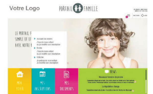
Visuel Portail famille