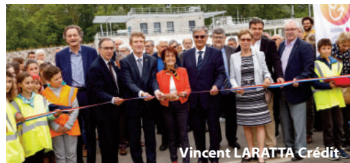
Vincent LARATTA Crédit

Nouvelle station d'épuration inaugurée le 14 juin 2019, pensée pour répondre aux besoins futurs liés à l'évolution démographique et à l'urbanisation croissante des communes d'Ayguésvives, Baziège et Montgiscard.